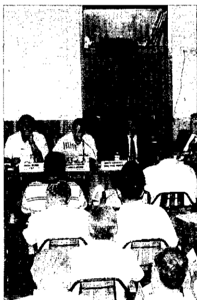
Charla de la Agencia.

En el citado curso, que impartirá la Unidad de Salud Laboral de Torrent de forma gratuita, se obtendrá el carnet de nivel básico.