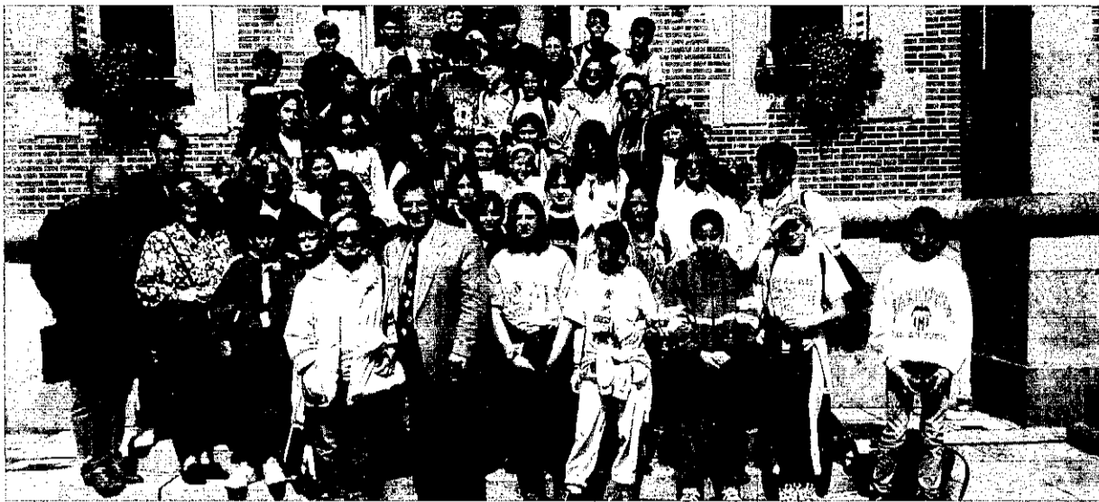
Grupo de alumnos de Picanya en uno de los intercambios culturales con Panazol.