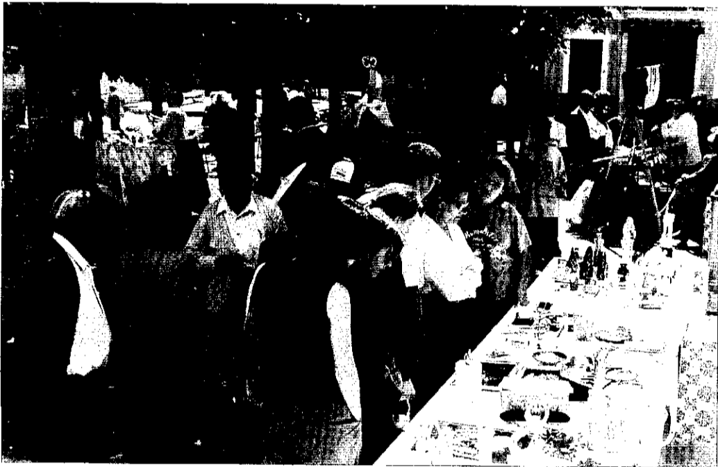
La colaboración de vecinos y vecinas en II Rastre Solidari permitió recaudar fondos para ayudar al pueblo saharauí.

La recaudación del II Rastre Solidari permite que 10 jóvenes saharauis pasen un mes en Picanya