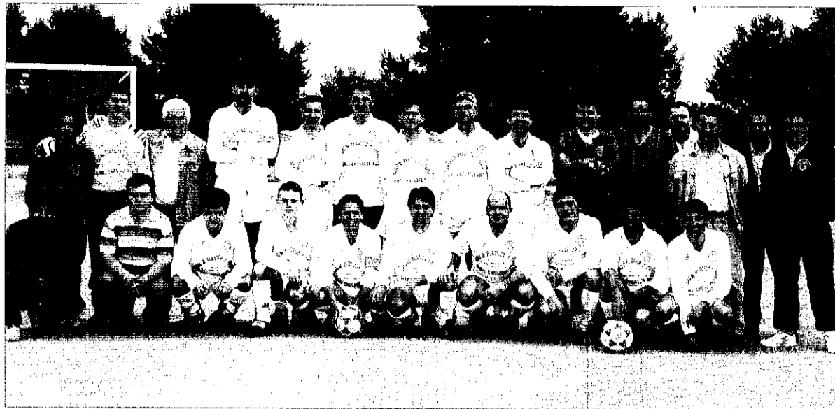
Equip de futbol Sebas Solo CF de Picanya.