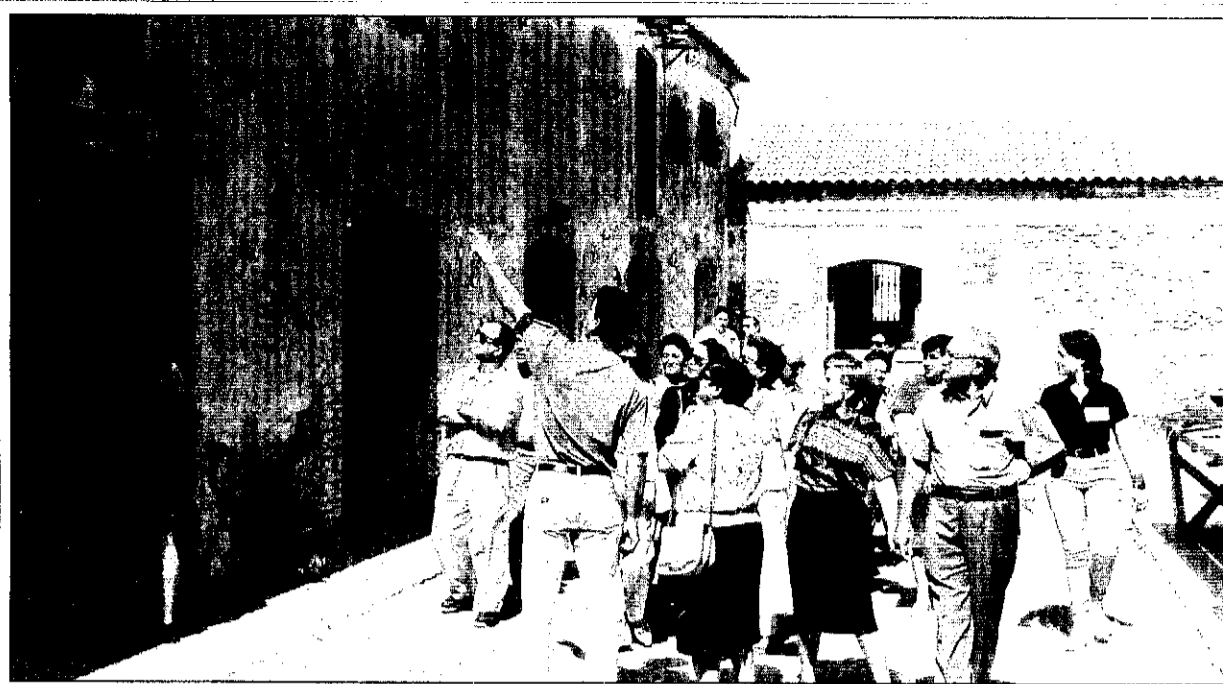
El públic va recórrer les instal·lacions de la restaurada Alqueria de Moret.