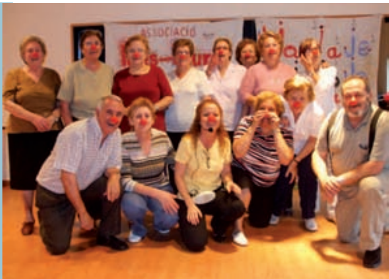
Taller de "risoteràpia" per a persones majors