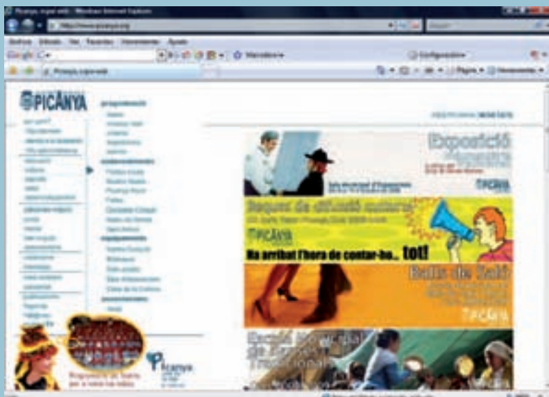
Renovació integral de l'espai web municipal