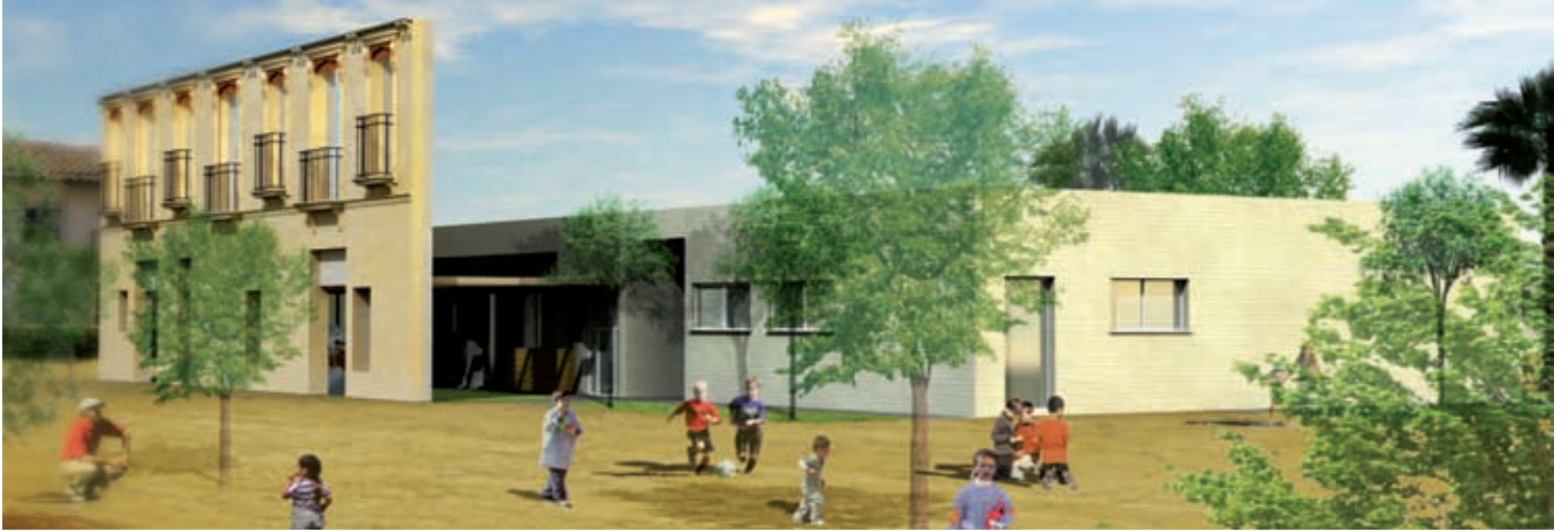
Projecte d'escoleta infantil de 0 a 3 anys