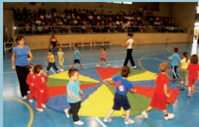
Xiqui-ritme al pavelló

Ahora se apela a la solidaridad, al desarrollo sostenible, a la educación, a la formación, a la convivencia, al respeto al medio ambiente... como activos para salir de la crisis. Unos valores que en nuestro municipio son bandera de la gestión municipal desde hace muchos años.