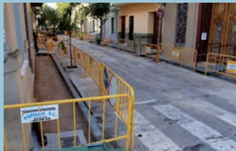
Millors a les vorers