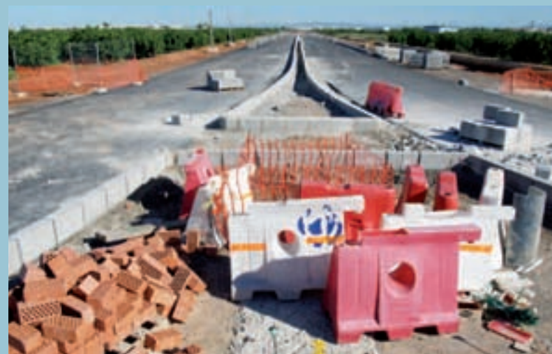
Obres de la Ronda Oest