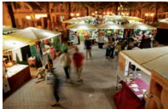
Fira del Xicotet Comerç

Altres iniciatives en matèria de medi ambient han estat l'inici de la substitució dels actuals semàfors per altres models amb luminàries de baix consum o la programació de cursos de conducció eficient per a professionals del volant.