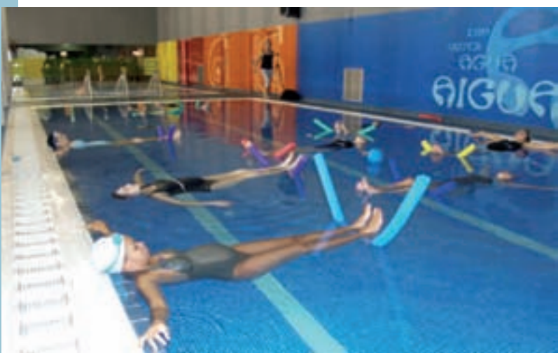
Programa de matronatació a la Piscina Coberta Municipal

Una medida fundamental ante la crisis es, sin duda, no incrementar la presión fiscal sobre el presupuesto disponible de las familias. En este sentido el Ajuntament de Picanya no aplicará en 2009 ningún aumento en impuestos municipales como los de vehículos, plusvalías, tasas, y la mayoría de precios públicos... y aplicará subidas muy ligeras (como máximo cercanas al IPC de 2008) a otros gravámenes. Ejemplo claro de esta política es el caso del IBI, popularmente conocido como "contribución", cuya revisión por el incremento del valor de mercado de las viviendas ha sido amortiguada por la reducción del tipo aplicado por nuestro consistorio que ha pasado del 0'90% al 0'80% por primera vez en los últimos 20 años.