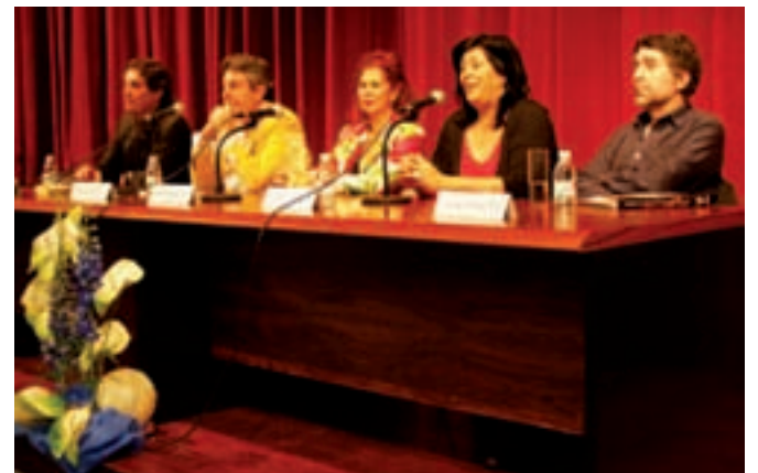
Noves iniciatives culturals

Tot i que ja s'havien desenvolupat algunes iniciatives en aquest sentit, durant 2008 s'ha abordat definitivament aquesta qüestió i des de l'Àrea de Seguretat Ciutadana s'han portat endavant diferents cursos i tallers a les escoles per tal de dotar a menuts i menudes d'uns mínims coneixements sobre interpretació de senyals, circulació a peu o amb bicicleta, comportaments, etc.