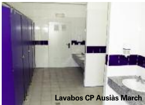
Lavabos CP Ausiàs March

dat desocupat a la part posterior de l'edifici, que dona a l'avinguda Sanchis Guarner. Al Poliesportiu de Picanya, han començat ja les obres per a la construcció dels lavabos sota la