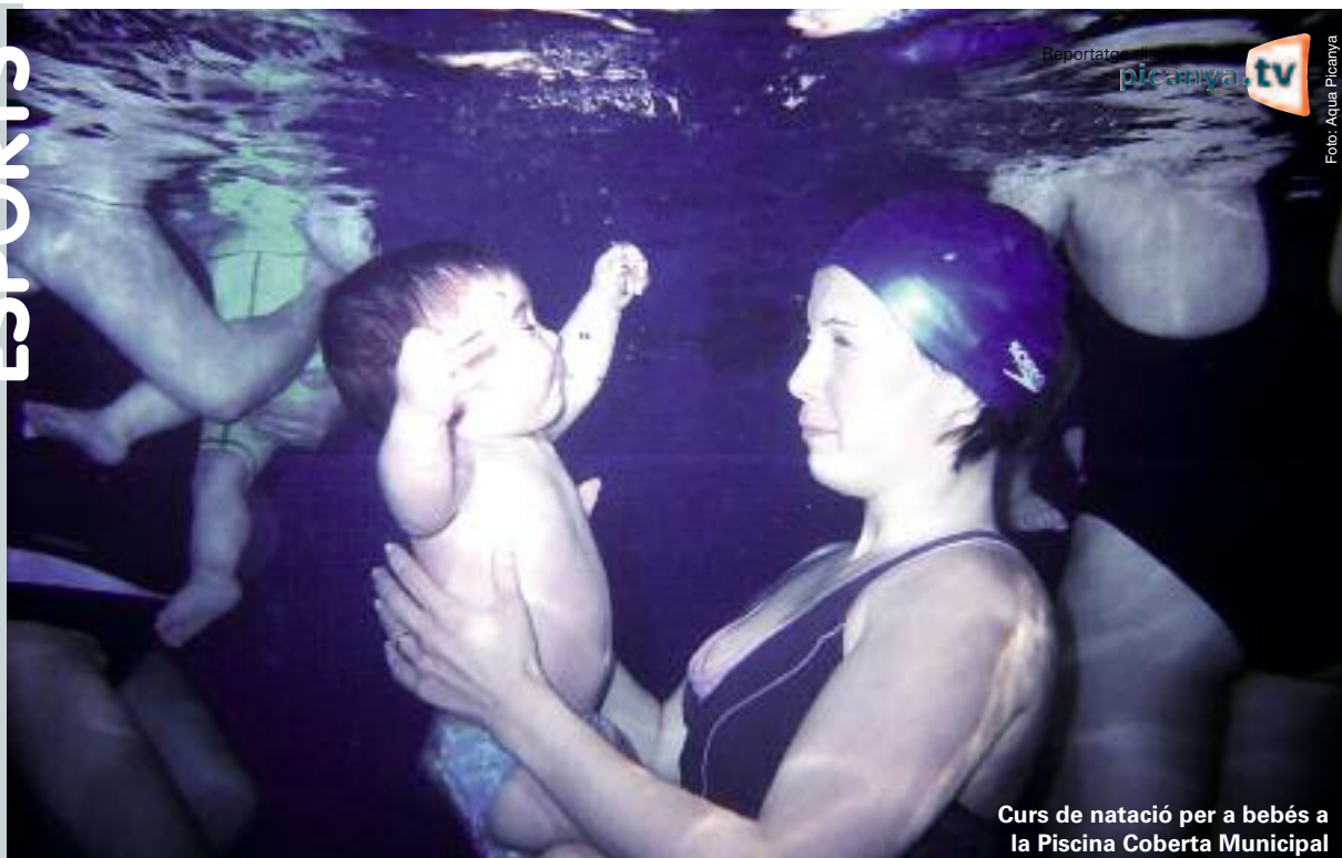
Curs de natació per a bebès a la Piscina Coberta Municipal