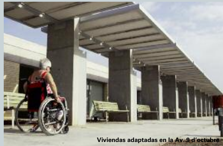
Viviendas adaptadas en la Av. 9 d'octubre

El esfuerzo para poner en marcha este nuevo recurso (un recurso novedoso que no se puede encontrar más que en otro pueblo de nuestra Comunidad) ha sido ímprobo y las dificultades de todo tipo que se han planteado a lo largo del proceso de construcción y dotación han sido considerables. Pero el esfuerzo, el realizado y el que queda por realizar ha merecido la pena porque unas personas mayores que lo estaban pasando realmente mal, ahora estarán mejor. Así de simple, así de importante.