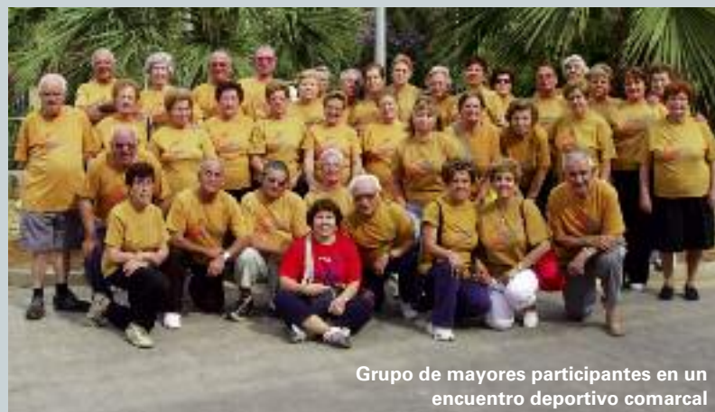
Grupo de mayores participantes en un encuentro deportivo comarcal

Els veïns i veïnes de Picanya han tingut prioritat en l'adjudicació i cap sol·licitud, presentada en termini, ha estat rebutjada