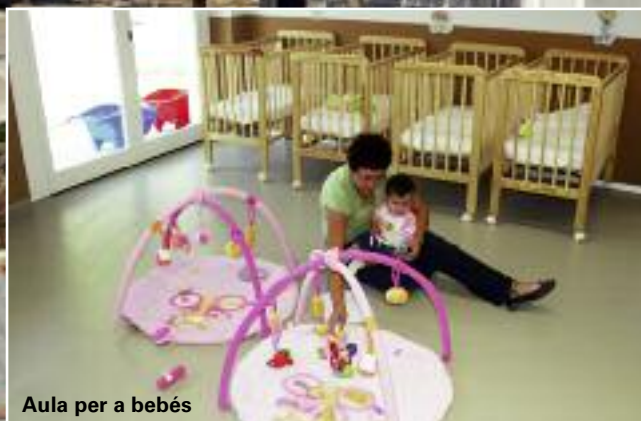
Aula per a bebés

A principis de setembre, les portes de la nova Escola Infantil Municipal "La Mandarina" van obrir-se per a acollir el seu primer alumnat. Finalment, el nostre poble arrodoneix l'oferta d'educació pública amb aquest modern centre que atén la població de 0 a 3 anys. L'única que, fins ara, no disposava d'oferta pública a Picanya. Un altre compromís complit.