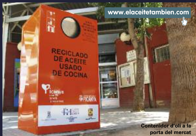
Contenedor d'oli a la porta del mercat

La instalación supone, además del evidente beneficio medioambiental, un beneficio a la hora de la generación de empleo y también una fuente de ingresos para el pueblo de Picanya que, a cambio del "alquiler" de estos techos, recibirá unos ingresos (cifrados en 5,5 millones de euros en los próximos 25 años) por parte de las empresas adjudicatarias.