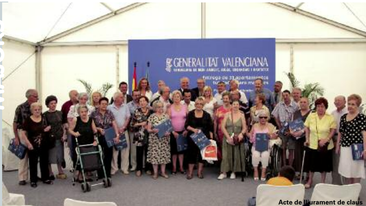
Acte de lliurament de claus