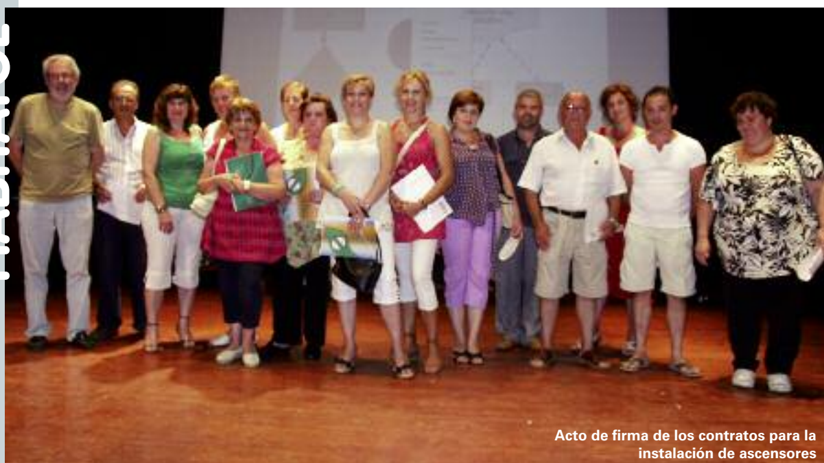
Acto de firma de los contratos para la instalación de ascensores

Más información en el Ayuntamiento (tel. 961 594 460) o a través de Internet www.picanya.org