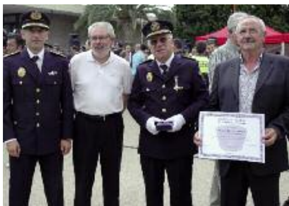
Acto de entrega de medallas

La visita ha estat ben interessant per a totes les persones que hi han participat. Així mateix des de l'Associació d'Agermanament s'han concretat les activitats i visites de ambdues poblacions per a l'any 2010.