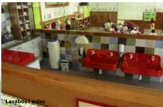
Lavabos i aules