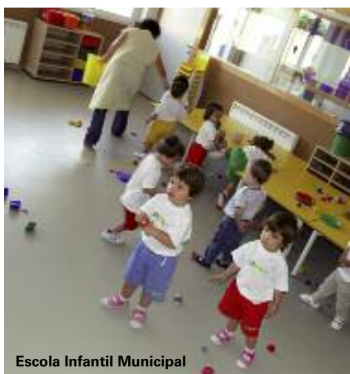
Escola Infantil Municipal

Picanya dispone desde este mismo curso de una Escuela Infantil Municipal para niños y niñas de 0 a 3 años. Un centro completamente adaptado a la ley y homologado por la Conselleria que ha dado respuesta a todas las solicitudes presentadas y que en este momento ya atiende a más de 70 alumnos y alumnas.