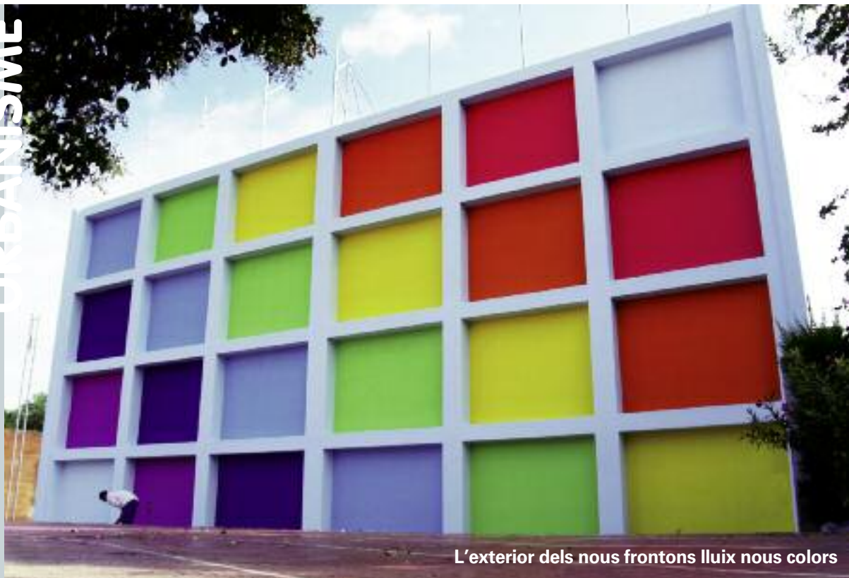
L'exterior dels nous frontons llueix nous colors