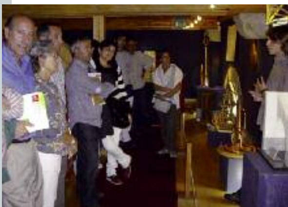
Un moment de la visita

Tant l'Ajuntament de Picanya com AXCP-AEPI, volen agrair la col·laboració de les persones i entitats que han afavorit l'èxit d'aquesta edició, especialment al Comitè de Jumejage, l'Associació de Comerciants i l'Ajuntament de Panazol.