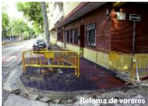
Refoma de voreres

graderia del camp de futbol. A més a més, les obres de cons-